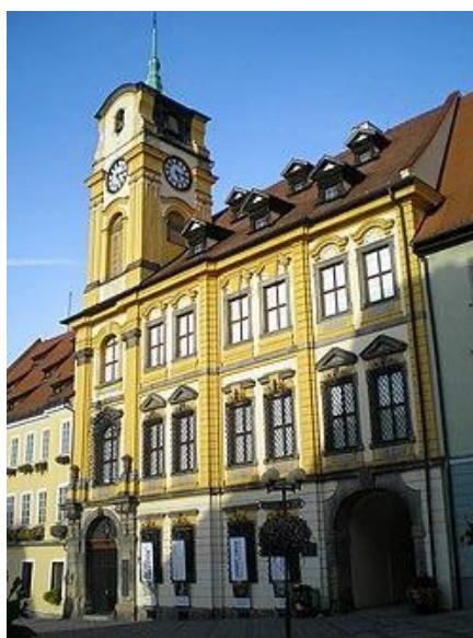
Obr. č. 1

Nakreslete tvar štítu nejstaršího a zároveň nejvýstavnějšího domu na náměstí? (Schirdingerův dům)