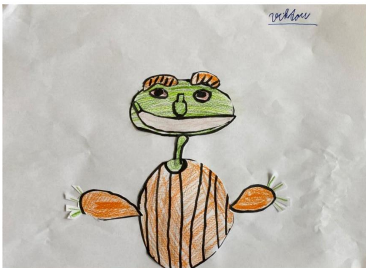
Viktor – nakreslil si sám jednotlivé díly – nejednoznačně byla hodnocena kritéria barevné a výrazné – dohodli jsme se s Viktorem na 2