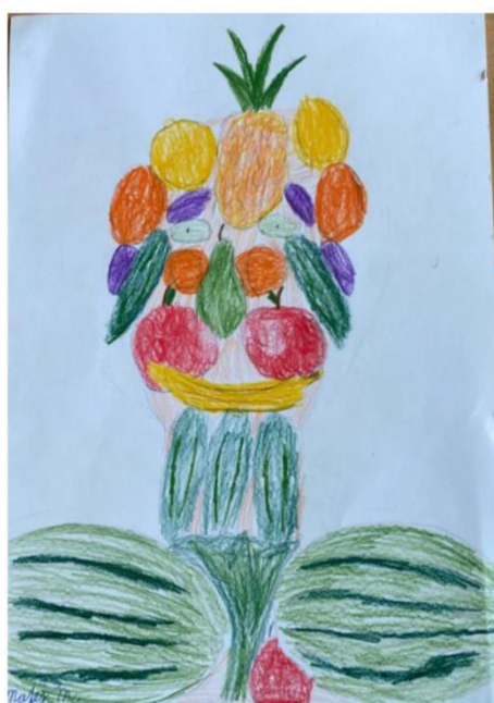
Matěj - nejsou splněna kritéria koláže (koláž z dílů a nalepené) – splněna 3 kritéria – 2