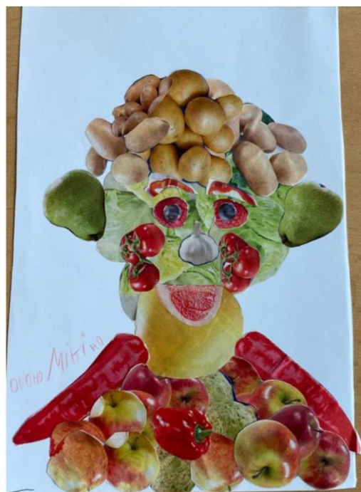
Miki – splněna všechna kritéria - 1