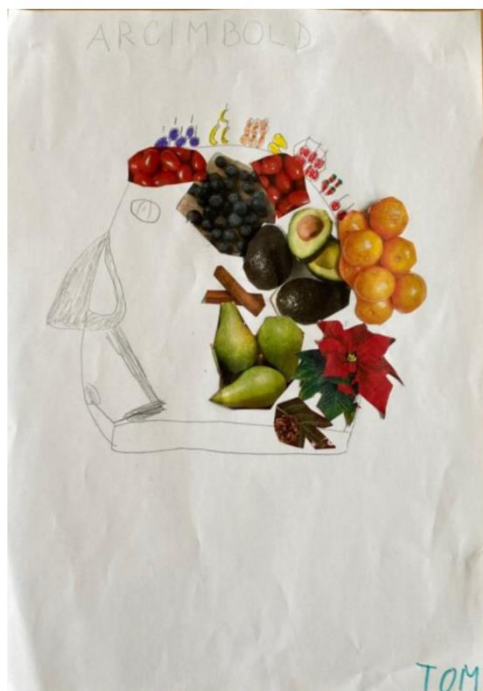
Tom - nejednoznačné hodnocení výraznosti, uznána 4 kritéria - 1