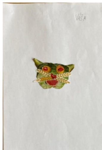
Váša – nejednoznačně hodnoceno kritérium - výrazné kvůli velikosti – splněna 4 kritéria - 1