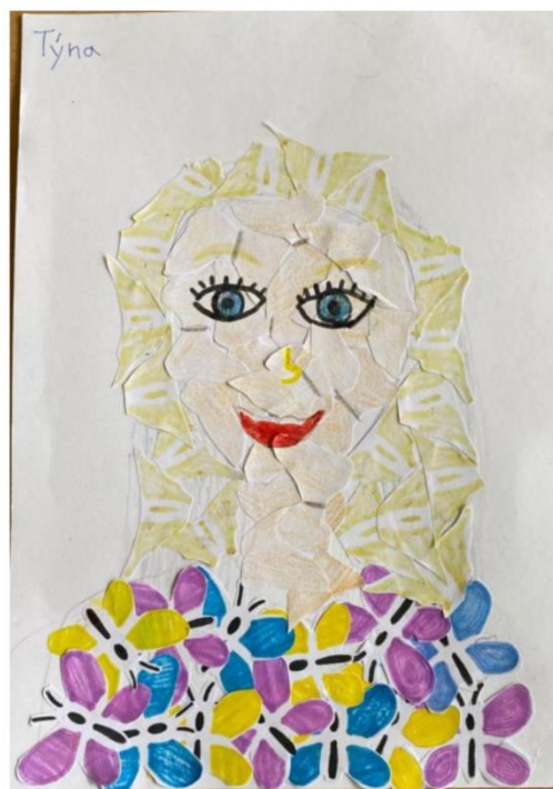
Týna – nejednoznačně hodnoceno kritérium – výrazné – někteří motýli jsou nevýrazní – splněna 4 kritéria – 1