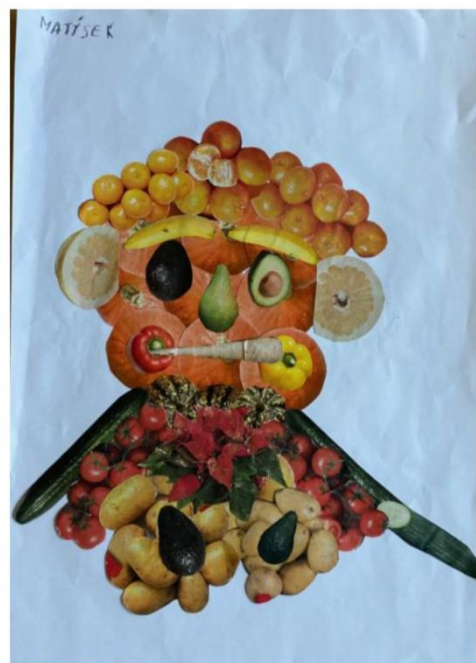
Matýsek – splněna všechna kritéria - 1