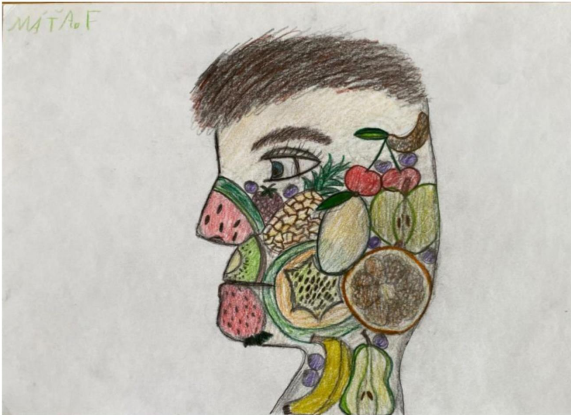
Máta – nejsou splněna kritéria koláže (koláž z dílů a nalepené) – splněna 3 kritéria – 2